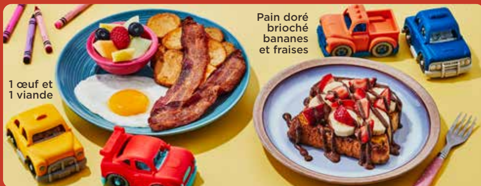
1 œuf et 1 viande