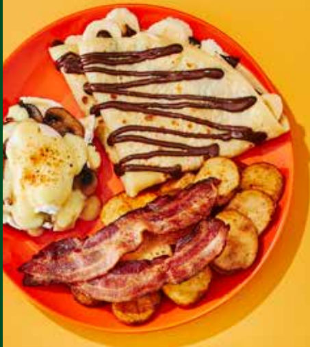
L'indécis bénédicte et crêpe

Remplacez vos pommes de terre par une poutine 4,95$