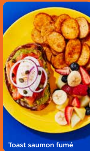
Toast saumon fumé

Saumon fumé N 17 95 Pain levain épicié, cheddar, guacamole, saumon fumé et œuf poché, servi avec pommes de terre rissolées et fruits frais