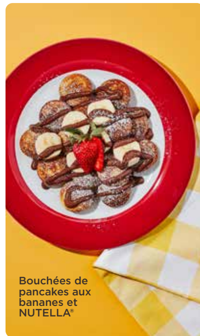
Bouchées de pancakes aux bananes et NUTELLA®

Bouchées de pancakes N Bananes et NUTELLA® 10 95 Fraises et NUTELLA® 11 95