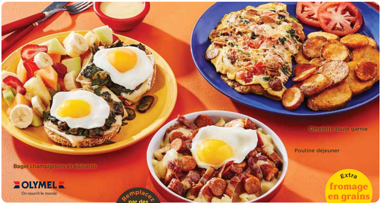
Bagel champignons et épinards