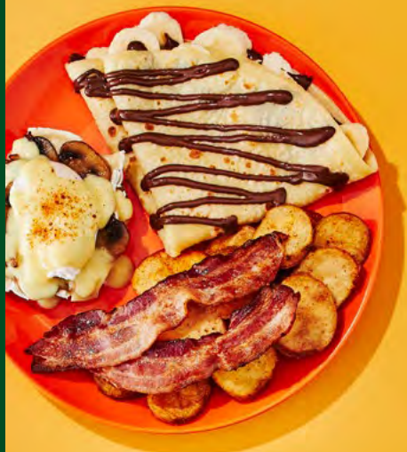
L'indécis bénédicte et crêpe

Remplacez vos pommes de terre par une poutine 4,95$