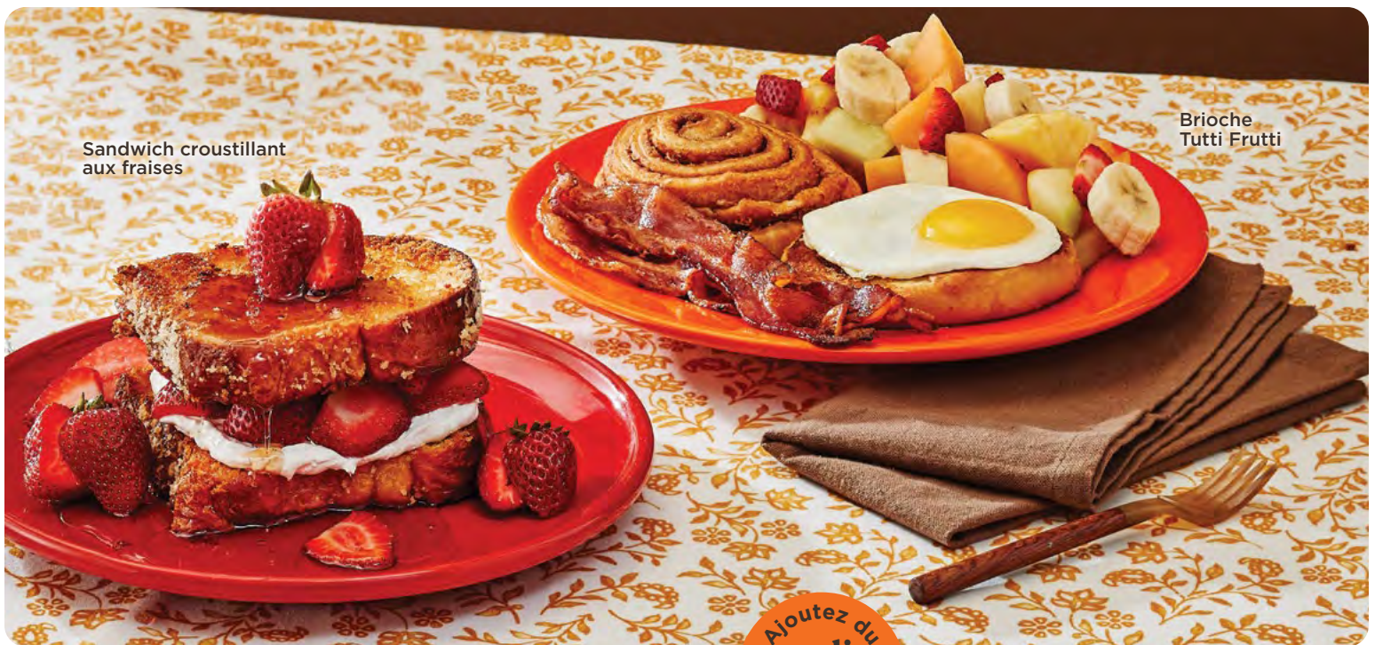
Sandwich croustillant aux fraises