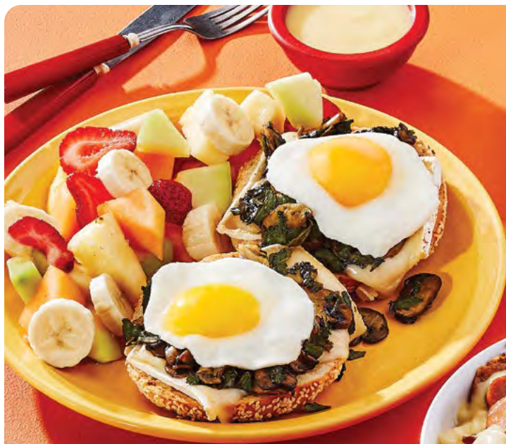
Bagel champignons et épinards