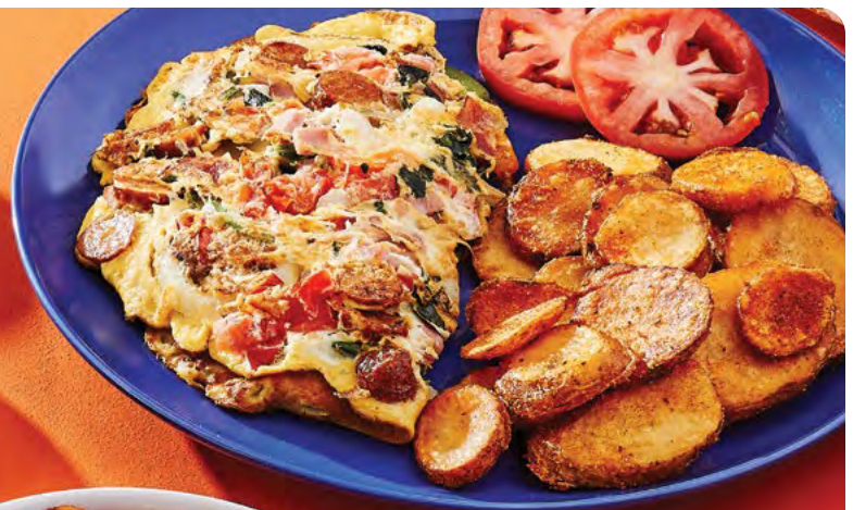
Omelette toute garnie