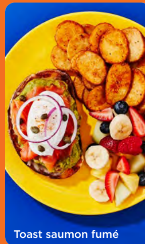
Toast saumon fumé