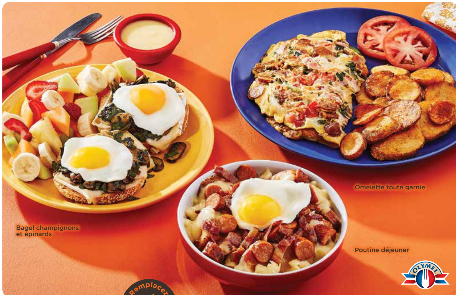
Bagel champignons et épinards