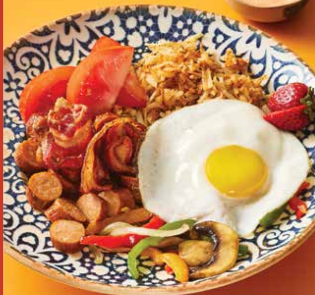
Bol déjeuner Bacon et saucisses