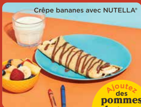
Crêpe bananes avec NUTELLA®

Ajoutez des pommes de terre rissolées 3,25$