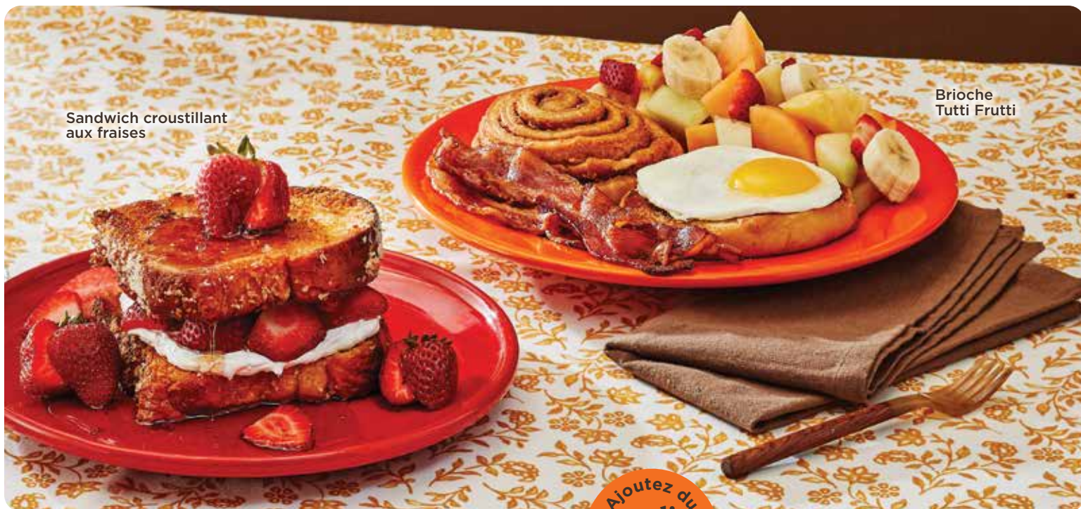
Sandwich croustillant aux fraises