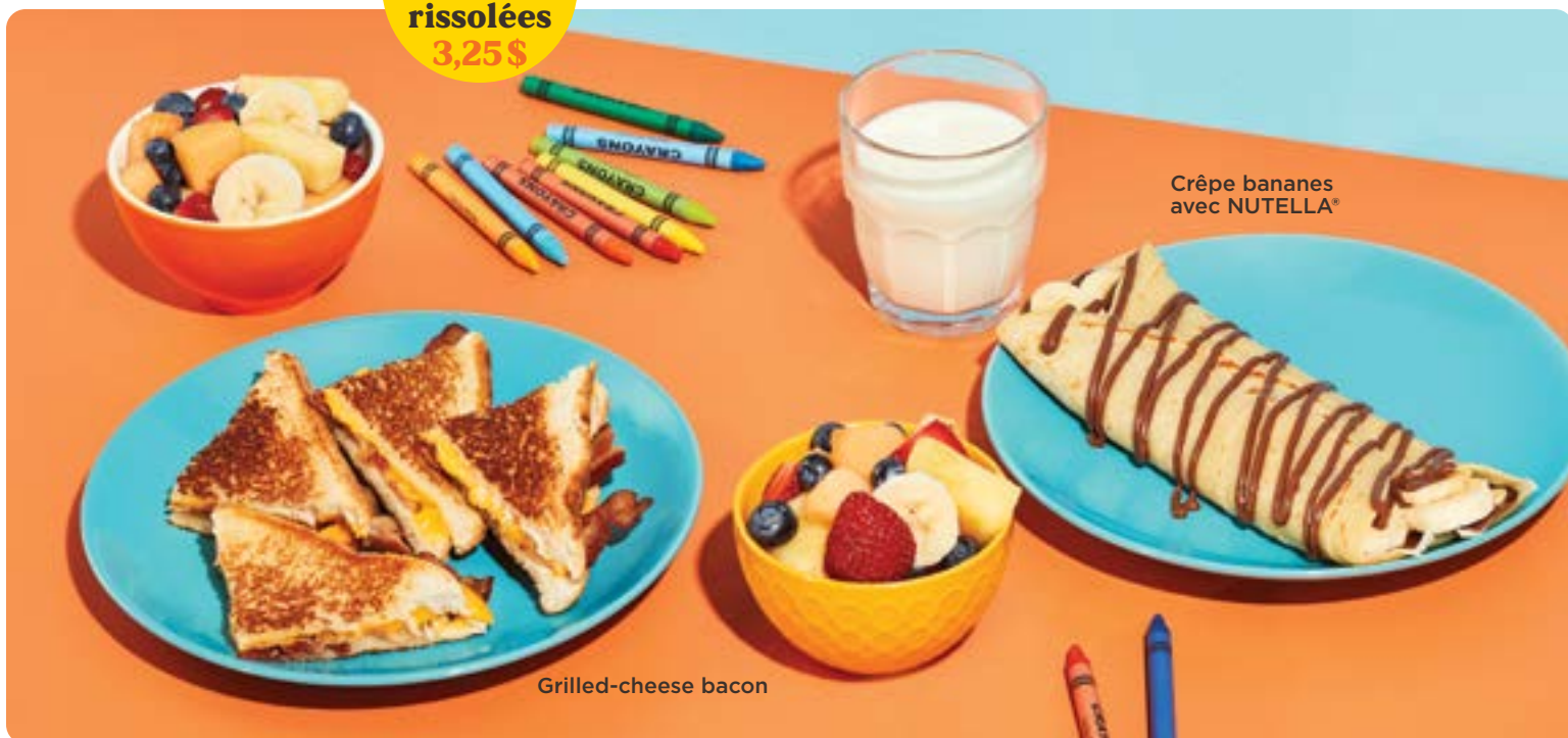
Crêpe bananes avec NUTELLA®

Ajoutez des pommes de terre rissolées 3,25 $