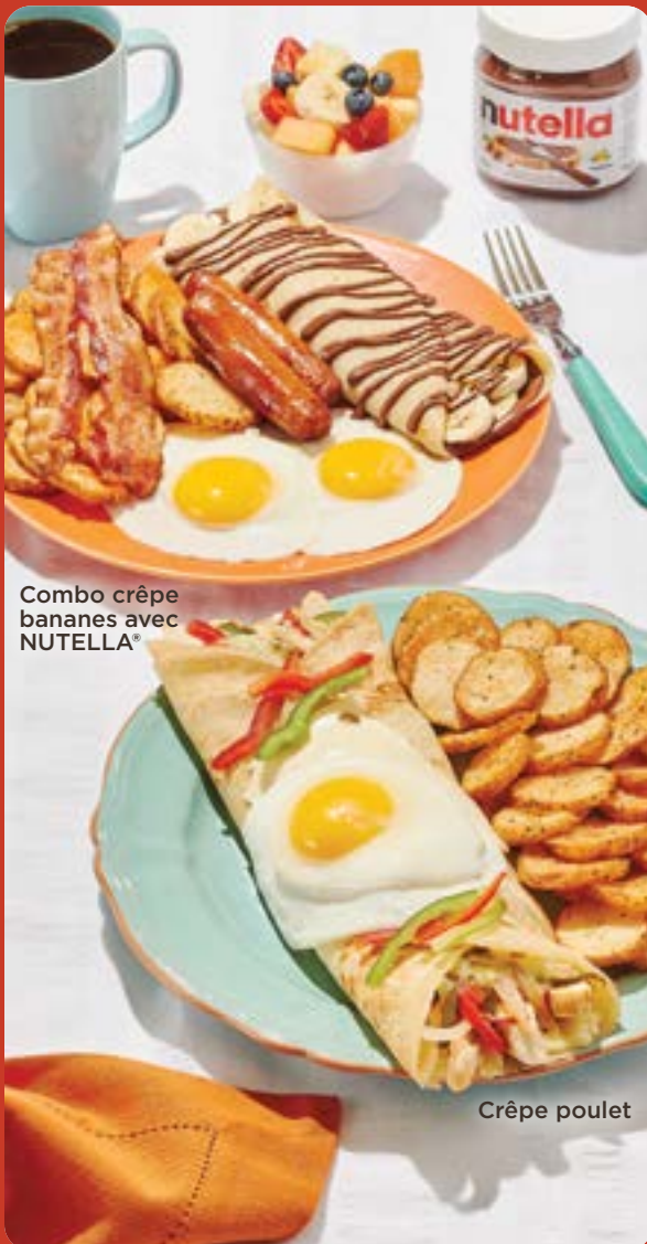
Combo crêpe bananes avec NUTELLA®

Farcie de saumon fumé, fromage à la crème et oignons caramélisés. Garnie d'un œuf, câpres et accompagnée de sauce hollandaise