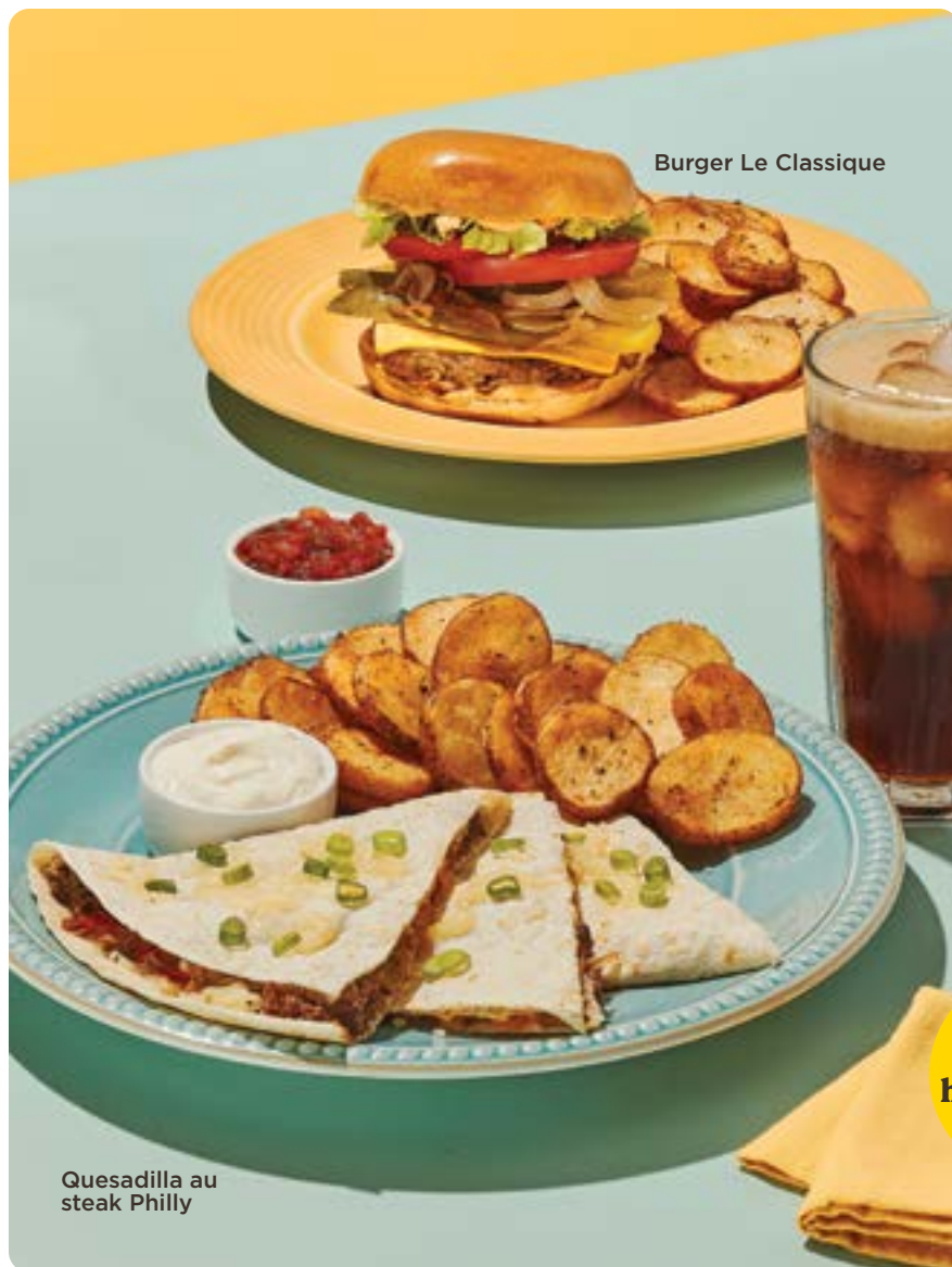
Burger Le Classique