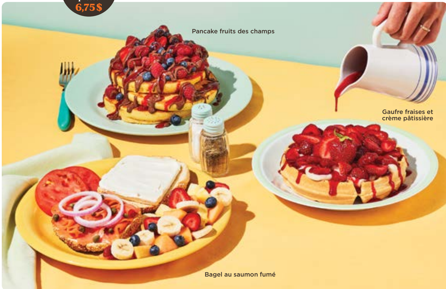
Pancake fruits des champs

Ajoutez un jus d'orange fraîchement pressé 6,75$