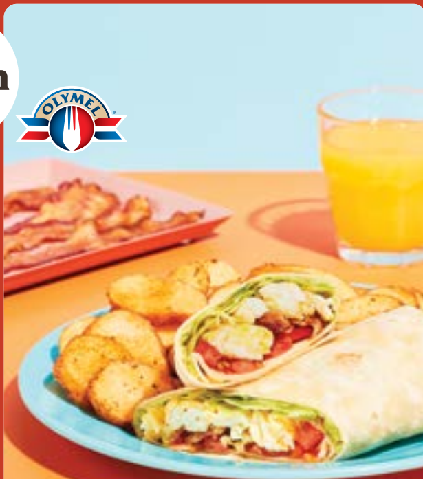
Wrap déjeuner BLT