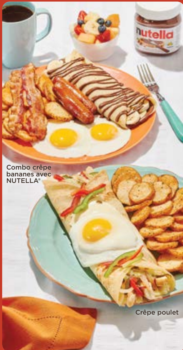
Combo crêpe bananes avec NUTELLA®

Farcie de saumon fumé, fromage à la crème et oignons caramélisés. Garnie d'un œuf, câpres et accompagnée de sauce hollandaise