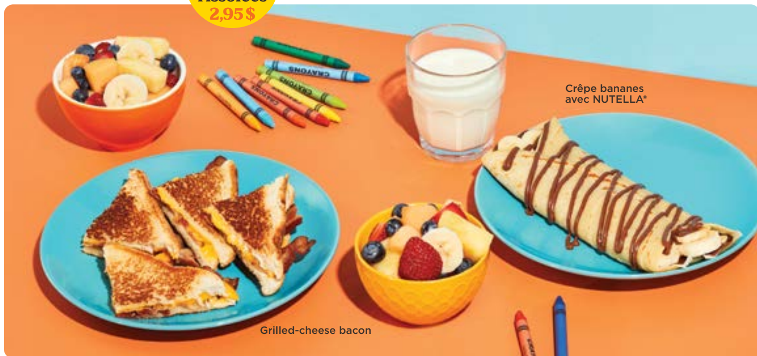
Crêpe bananes avec NUTELLA®

Ajoutez des pommes de terre rissolées 2,95$