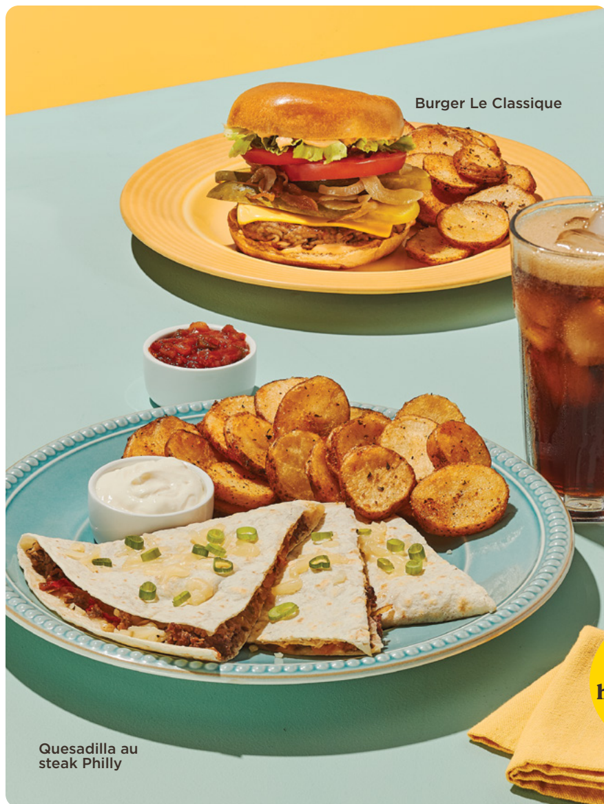
Burger Le Classique