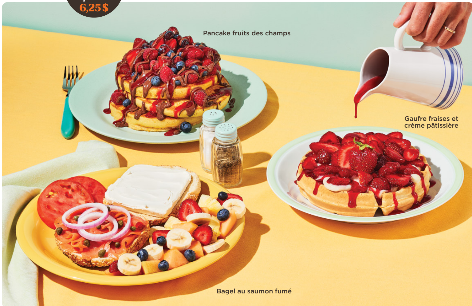
Pancake fruits des champs

Ajoutez un jus d'orange fraîchement pressé 6,25$