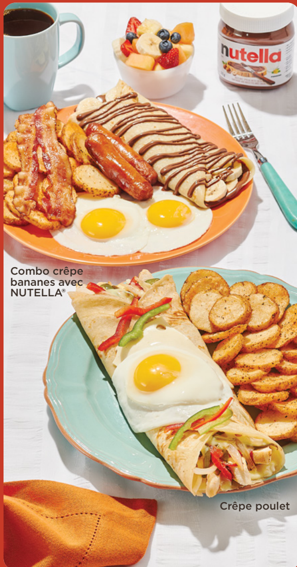
Combo crêpe bananes avec NUTELLA®

Farcie de saumon fumé, fromage à la crème et oignons caramélisés. Garnie d'un œuf, câpres et accompagnée de sauce hollandaise