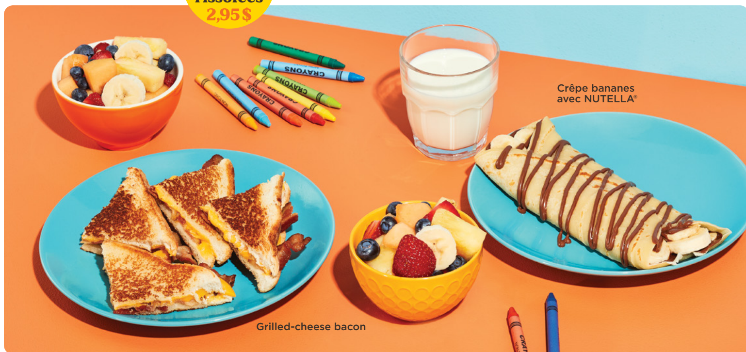
Crêpe bananes avec NUTELLA®

Crêpe garnie de bananes et d'un coulis de NUTELLA®, servie avec un bol de fruits frais