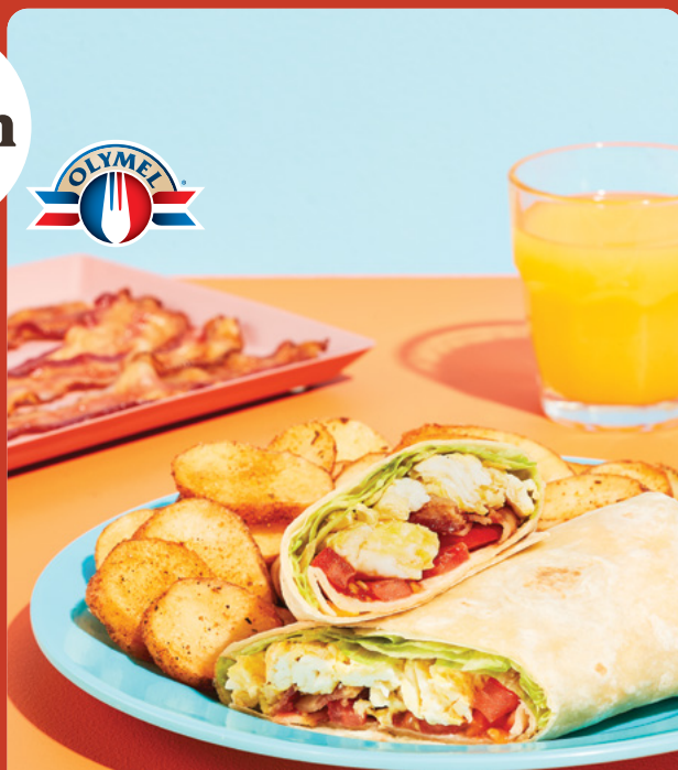
Wrap déjeuner BLT

Fromage jaune, suisse et cheddar. Garnie d'oignons verts et servie avec pommes de terre rissolées